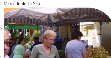
Mercado de La Seu

LAS FERIAS Último domingo de mayo: Feria de plantas medicinales y productos naturales. Tuixent Segundo sábado de octubre: Feria del Niscolo. Coll de Nargó Tercer domingo de octubre: Feria de Sant Ermengol (incluye la Feria de Quesos Artesanos del Pirineo). La Seu d'Urgell. 1 de noviembre: Feria de Todos los Santos. Oliana Último domingo de noviembre: Feria de Sant Andreu. Organyà Puente de la Constitución: Feria del Valle. Tuixent