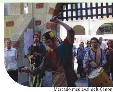
Mercado medieval de los Canónigos

LOS MERCADOS Martes y sábados: La Seu d'Urgell Sábados: Oliana Domingos: Organyà