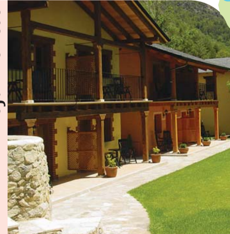
Alojamiento en la Seu d'Urgell