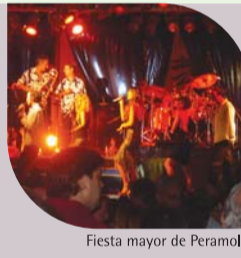
Fiesta mayor de Peramola

MAYO 1r domingo: Aravell 3r domingo: Aguilar de Bassella y Montan Último domingo: Sant Joan Fumat y Sallent de Montanissell Segunda Pascua (mayo o junio): Arfa JUNIO 2n domingo: Cerc 3r domingo: Ossera y Castellnou de Carcolze Último domingo: Cornellana y Os de Civis